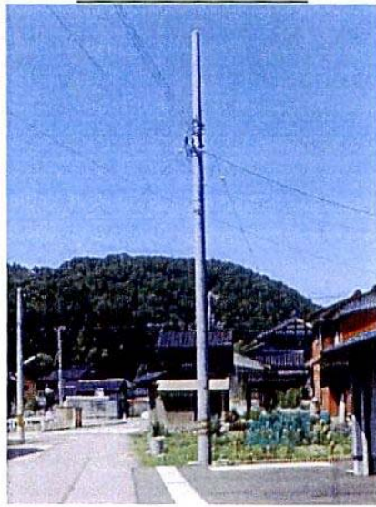
着 工 後