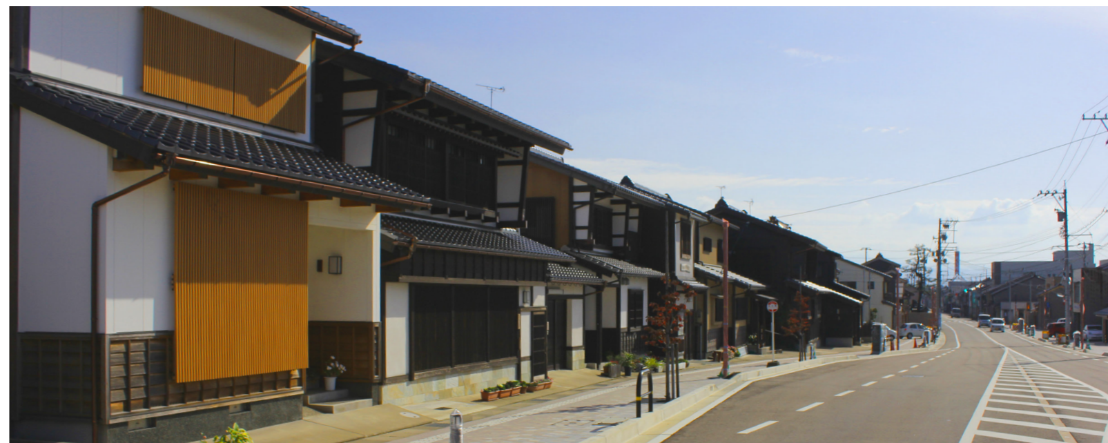
大川やわらぎ街道