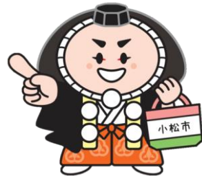
小松市イメージキャラクター カブッキー

前回同様、市外に本店等がある大手量販店も、小松商工会議所の会員であれば対象になります