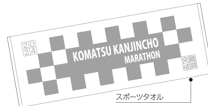
スポーツタオル 生地色…白 プリント…シルバー サイズ…40x110cm

※素材：リサイクルポリエステル75%以上使用/吸汗速乾・UPF15・ダイナモーションフィット