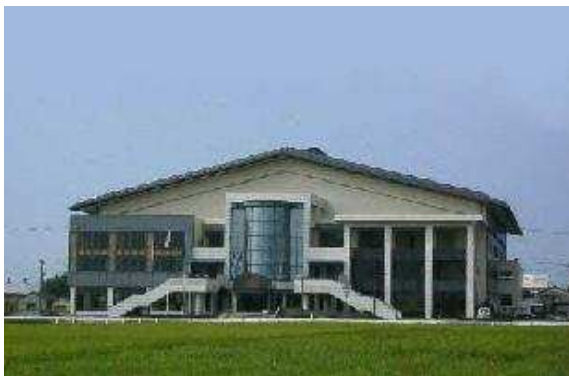
小松総合体育 外観