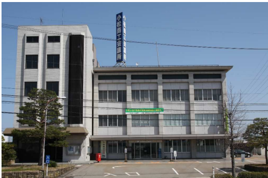
小松商工会議所 外観