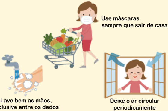
Lave bem as mãos, inclusive entre os dedos

Siga os cuidados básicos para a prevenção de doenças contagiosas.