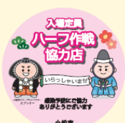
Selo de participação do “Plano Lotação pela Metade”

Pedimos que os comerciantes sigam as regras e diretrizes estabelecidas pelos órgãos responsáveis.