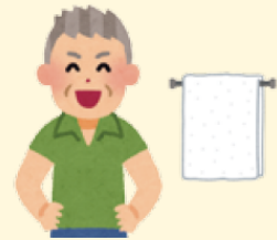
Não compartilhe toalhas ou roupas

4. Aumente sua imunidade: faça refeições balanceadas, pratique exercícios leves regularmente etc.