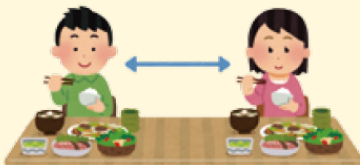
Mantenha uma distância segura

3. Ações em família: cuidado com o aumento de casos em ambiente familiar