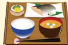
Divida os alimentos em porções individuais

Nosso lar é onde nos sentimos mais seguros, mas não podemos nos esquecer de que o vírus pode estar em qualquer lugar. Caso sinta algum dos sintomas ou qualquer preocupação, não hesite em contatar seu médico ou centros de consulta e apoio.