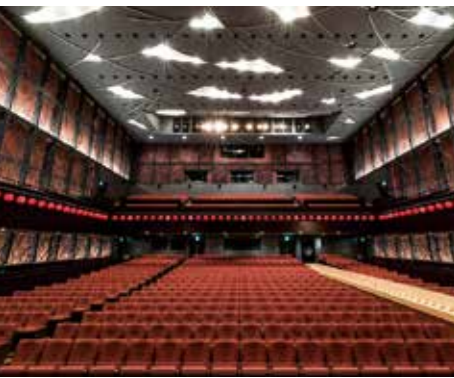
團十郎芸術劇場うらら 施設の長寿命化とグレードアップに向けた大規模改修