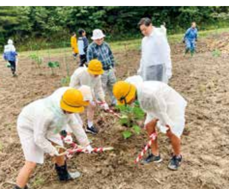
農山村地域の持続可能な地域社会の形成へ早成日本桐活用効果実証事業を実施