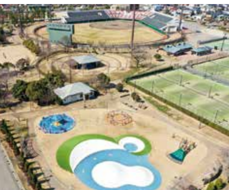
小松運動公園テニスコートなどの整備に向け実施設計へ