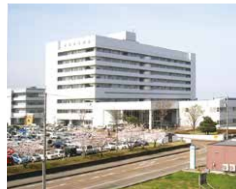
新病院建設に向け基本設計に着手