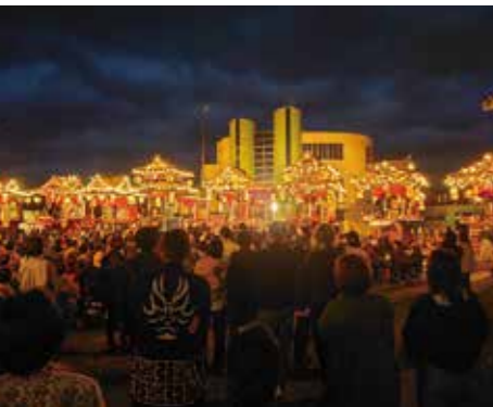
曳山行事の継承へ保存展示施設を整備