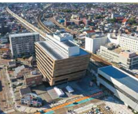
新産業創出に向けた取り組みを強化