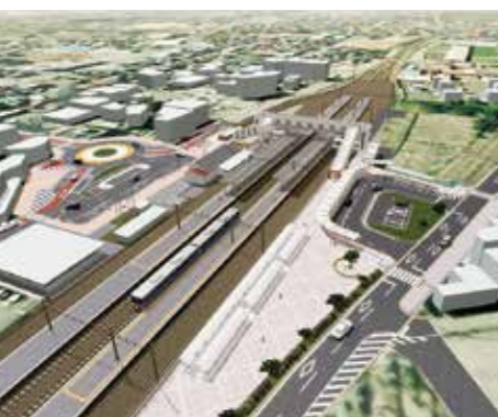
南部エリアの玄関口 栗津駅を再構築