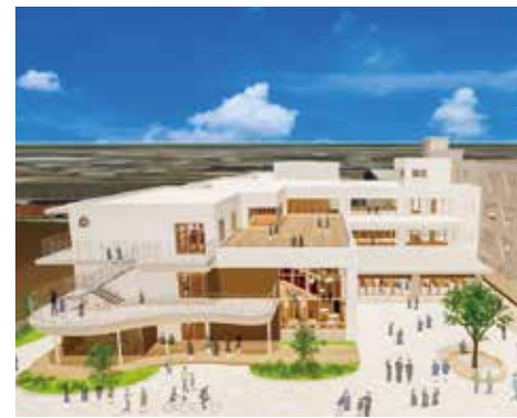
安全性と快適性を高めた機能的な校舎へ松陽中学校の工事に着手