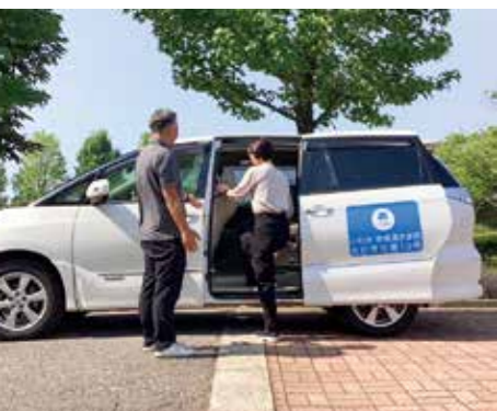
夜間ライドシェア、南部乗合ライドシェアを運行