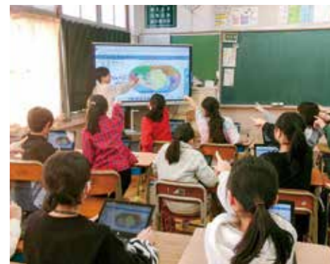
小中学校に電子黒板を整備