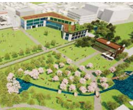
「小松の新時代の象徴」に向け未来型図書館等複合施設を整備を開始