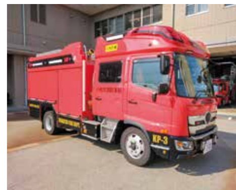
高機能消防ポンプ車を南消防署へ配備