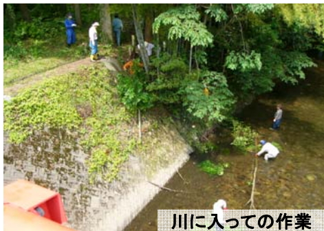
川に入っでの作業