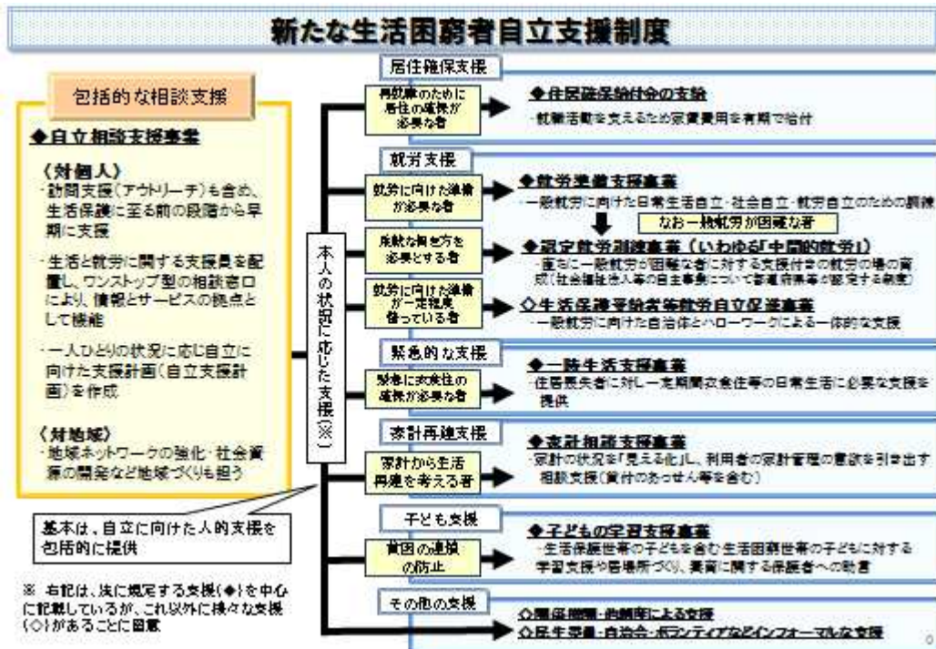
図表3 生活困窮者自立支援制度による包括的な支援